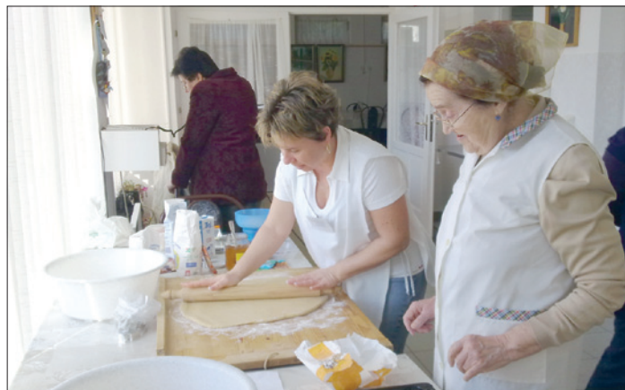
Aki szeret sütni-főzni, tegye azt! Ez másokat is megörvendeztet

Amennyiben Ön, kedves olvasónk, szívesen kalandozik a világhálón, és hasonló idézeteket talál vagy kap ismerőseitől, kérjük, küldje el a hogytetsziklenni@betunet.hu honlapunkra, hogy közkinccsé tehessek azt lapunk hasábjain.