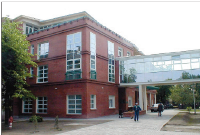
Intézményünk sokat fejlődött fennállásának több mint száz éve alatt

2006-ban ünnepeltük megalakulásunk 100. évfordulóját. Száz év alatt sokszor jelentkeztek nehézségek, számos változással kellett szembenézni, és a jövőben is új kihívásokra kell számítanunk. Dolgozóinknak az a képessége, hogy az orvostudomány eredményeihez, a gazdasági és társadalmi átalakuláshoz igazodni tudtak, és mertek változtatni, a kórház számára mindenkor a megújulás esélyét teremtette meg.