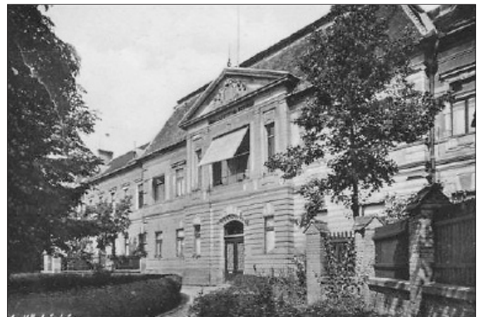
Korabeli felvétel a közkórházról