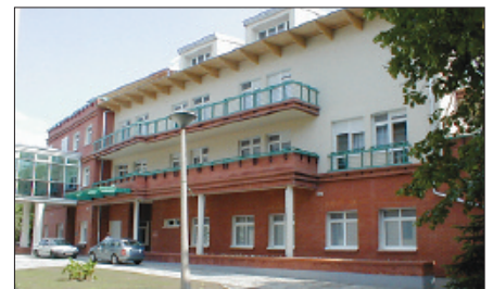
Korszerű épületben korszerű humán erőforrással kapcsolatos intézményi program

keretében zsírszázalék-, BMI-mérésen, táplálkozási tanácsadáson, testösszetétel-analízisen és szív-stressz állapotmérésen is. Mivel dolgozóink igen nagy stressznek kitéve, súlyos betegek ápolásával és elvesztésével kapcsolatos komoly lelki terheket hordoznak, lehetőséget nyújtunk egy kérdőíves felmérés elvégzésére, mely a burnout (kiégés) jelenséget vizsgálja. Az önkéntes és anonim módon kitöltött kérdőívek feldolgozását a pszichiátriai osztály orvosai végzik. A statisztikai feldolgozáson túl, probléma esetén szakorvosi segítséget is biztosítunk munkatársainknak.