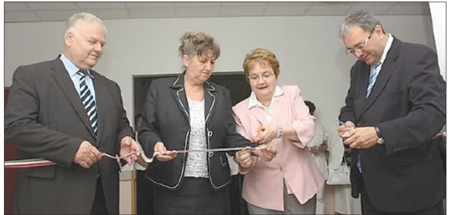
Az osztály hivatalos átadása 2011. június 29-én volt

Az összesen 1014 négyzetméteres és a legkorszerűbb orvosi műszerekkel felszerelt osztály építészeti kiadásai – melybe beletartozott a helikopterleszálló korszerűsítése is – 110 millió forintba kerültek. A fennmaradó összeget eszközbeszerzésre (EKG, defibrillátor, mobil ultrahang, mobil RTG, lélegeztetőgép, altatógép stb.) fordították.