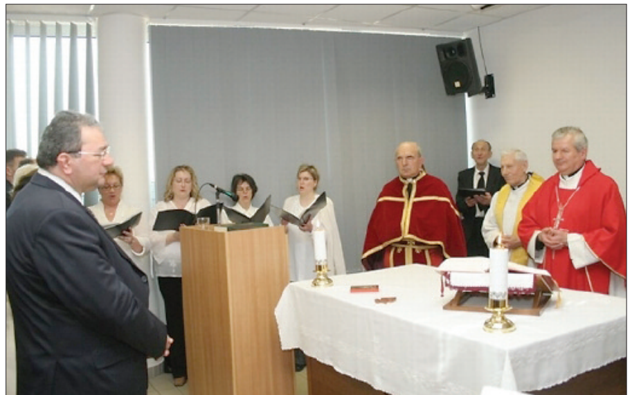
A szimpóziumot követő szentmisén Kiss-Rigó László püspök úr felszentelte az egyházmegye támogatásával kialakított kápolnát

A programhoz több résztvevő kapcsolódott és szándékozik csatlakozni,