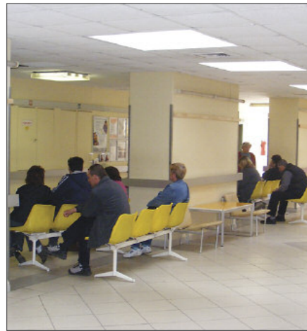
A zavartalan betegellátás érdekében tovább szeretnénk csökkenteni a várakozási időt

Terveink között szerepel, hogy újra- indítjuk a gyermek fül-orr-gége szakrendelést, és nemrég ismét megkezdte működését genetikai laboratóriumunk,