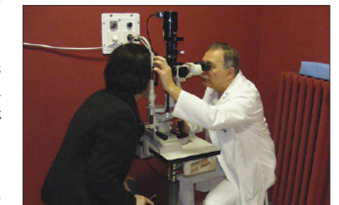
Az osztályon korszerű műszereket használnak