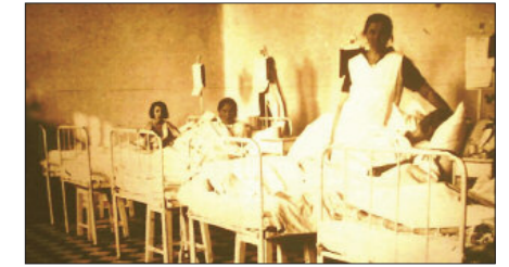
Egykor ilyen kórtermekben lábadoztak a betegek

A magyar orvosképzés szempontjából rendkívül jelentős nap 1769. november 25-e, amikor Egerben, az irgalmas barátok kórházában megnyílik az első hazai orvosi kar, a Schola Medicinalis. Markhot Ferenc orvosképzési elve a maga korában is kimagasló volt, mely szerint a hallgatók nemcsak elméleti, de kórházi gyakorlati képzésben is része-