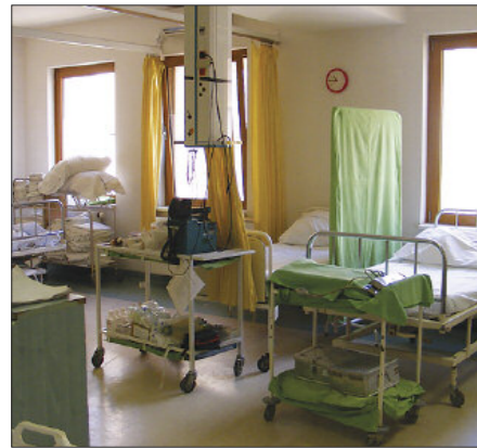
A diagnózis fölállításáig, de legfeljebb 24 óráig kezelik a hozzájuk érkezőket

Ellátjuk a mérgezett, a beutaló nélküli 16. életévüket betöltött belgyógyászati, szemészeti, fül-orr-gégészeti, urológiai, neurológiai, bőrgyógyászati, onkológiai,