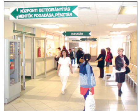
A házirendet mindenkinek be kell tartania