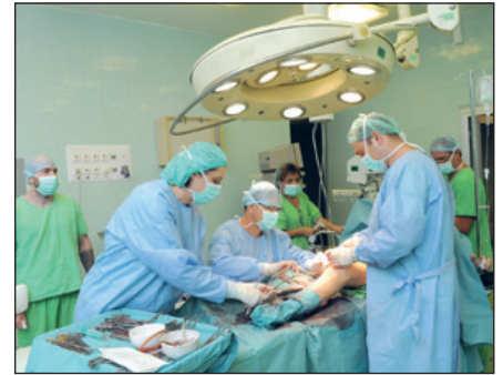
A traumatológián is nőtt a leterheltség

tott fekvőbeteg-ellátási területhez, s így lerövidülhetnek a betegutak, a betegek gyorsabban, kevesebb fáradtsággal jutnak hozzá a szükséges ellátáshoz.