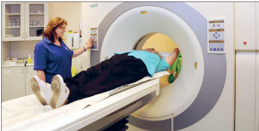
A jövőben még korszerűbb diagnosztika áll majd a gyógyítás szolgálatába

Az idei év a nagy fejlesztések éve kórházunkban, megkezdődik az ötmilliárdos beruházás, melynek eredményeként megújulnak épületeink, új nagy technológiai tömb épül, nagy értékű műszerbeszerzésekre nyílik lehetőségünk. Összességében közel 6 milliárd Ft-ot használhatunk föl arra, hogy a betegellátás feltételei minden területen javuljanak. Bízunk abban, hogy mindezek hozzájárulnak ahhoz, hogy betegeink még inkább elégedettek legyenek, bizalmuk erősödjön kórházunk iránt. Mint minden kórház, a fejlesztések ellenére számos gonddal küzdünk meg nap mint nap, de Markhot Ferenc példája alapján a több száz éves egri gyógyító munkára alapozva célunk nem lehet más, mint hogy magas színvonalú, hatékony, kulturált járó- és fekvőbeteg-el-