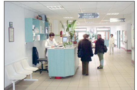
A vizsgálat nem érkezési sorrendben történik