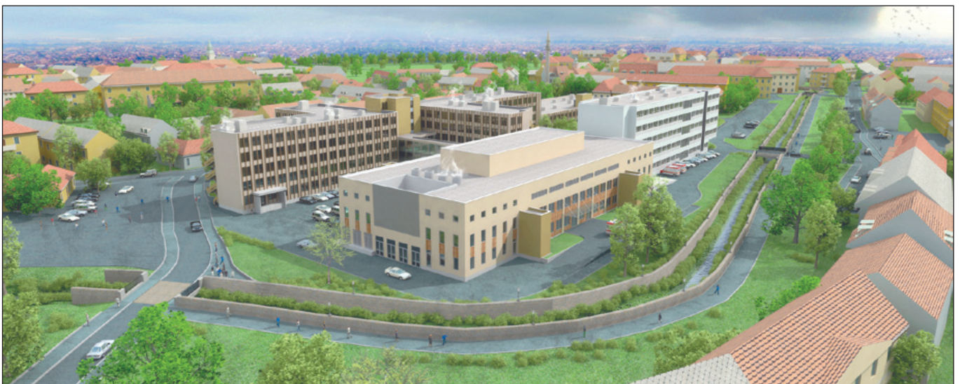
A fejlesztés hosszú évekre biztosítja a magasabb színvonalú és betegközpontú szakmai munkát a kórházban