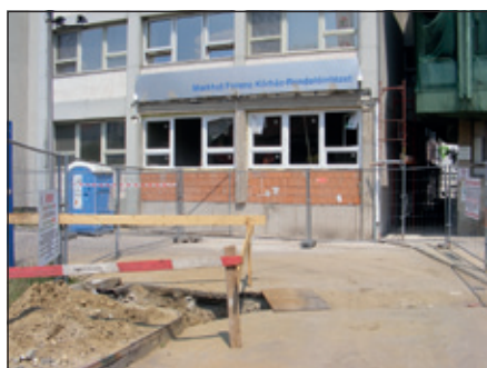
Akad még munka bőven

Uniós pályázat részeként épül a rehabilitációs kardiológiai szakrendelő az Árva közti bejáratnál. Az új épületrész a belgyógyászati tömb szomszédságában kap helyet, és hamarosan elkészül. Már a belső vezetékelési munkálatokat végzik.