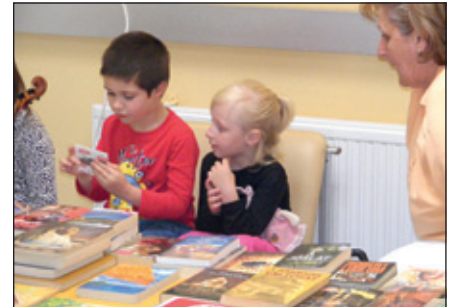
Itt könnyebben telik az idő