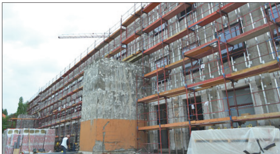
Nagyszabású építkezések zajlanak a kórházban

Kérjük betegeinket, hogy amennyiben a korábban jelzett időpontban mégsem tudnak megjelenni, úgy időben jelezzék azt, hogy helyükre más betegeket behívassunk. A sürgősségi betegellátó osztályon ezentúl a visszarendelt betegeket egy külön ellátó team kontrollálja, a sürgősségi ellátást nem igénylőket pedig átirányítjuk a járóbeteg-szakrendelőbe. Ezzel lecsökken a sürgősségin azoknak a száma, akik csak azért jelentkeznek ott, mert a kivizsgálásukkal nem akarják kivárni a szakrendelőben az időpontjukat. Az így felszabaduló kapacitásokkal a sürgős esetek ellátása gyorsul. Felújítjuk kórtermeinket, ehhez városi és megyei civil segítséget várunk. Elkészítettük a karbantartási-felújítási tervünket a leromlott állapotú épületeinkre. Számítunk arra, hogy a megyeszékhelyen működő vállalkozások, alapítványok támogatnak bennünket a felújításhoz szükséges eszközökkel, anyagokkal. Jó ütemben