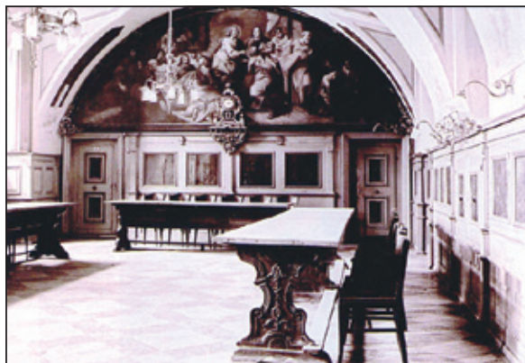
A gyógyítás szolgálatában 1727 óta...

A munkálatok során teljeskörűen felújítják a gépészeti vezetékhálózatot, így nemcsak komfortosítás történik meg, hanem valóban egy korszerű épületet kapnak az ott gyógyuló betegek és dolgozók.