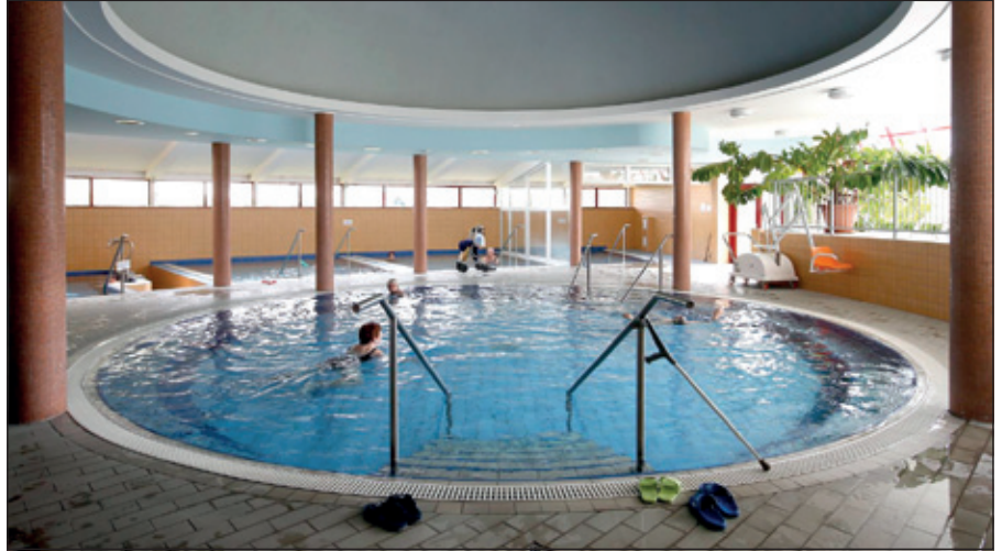
Gyógymedence: gyógyulás és rekreáció

valamint a különböző fizioterápiás kezeléseket (iontoforezisek, ultrahang, diadynamik, interferenciaáram-kezelés és mágneses kezelés) lehet igénybe venni. A reumatológiai osztályon kúra-szerű szolgáltatásokkal is várják a gyógyulni vágyókat.