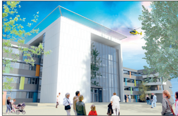
A betegutak is leegyszerűsödnek majd

Az intézményben jelenleg szétszórt pavilonrendszerekben történik a gyógyítás, amelyek nagy része elavult és korszerűtlen. A tömbkórház beruházás már szakít az eddigi építési gyakorlattal, így a betegutak is leegyszerűsödnek. Lebontásra kerülnek az elavult pavilonok több mint 15 ezer négyzetméteren.