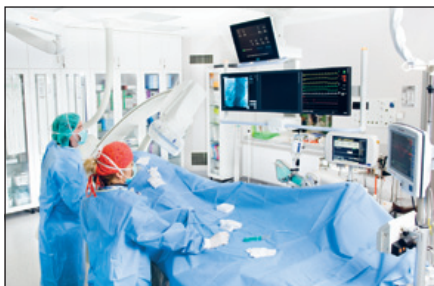
Műszerezettsége európai szintű

A megyében jelenleg 7 „a belgyógyászati angiológia képesített orvosa” képzettséggel rendelkező szakorvos dolgozik. Az angiológiai betegellátás műszerezettsége európai szintű (ultrahangvizsgálat, kapillármikroszkópia, CT, MR, angiographia).