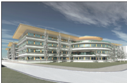
Korszerű ellátást nyújtó csúcshintézmény lesz

A használhatóság, a praktikus megoldások, a kényelemérzet, a méltó és betegközpontú ellátás a 21. században már olyan elvárások, melyeknek eleget kell tenniük az egészségügyi intézményeknek. Az elmúlt évtizedek legnagyobb egészségügyi beruházása az a 85 milliárd forintos program, amelynek keretében 8 póluskórház fejlesztése valósulhat meg. A fejlesztések hozzájárulnak ahhoz, hogy Szabolcs-Szatmár-Bereg megyében is létrejöjjön egy, a legkorszerűbb ellátást nyújtó csúcshintézmény.