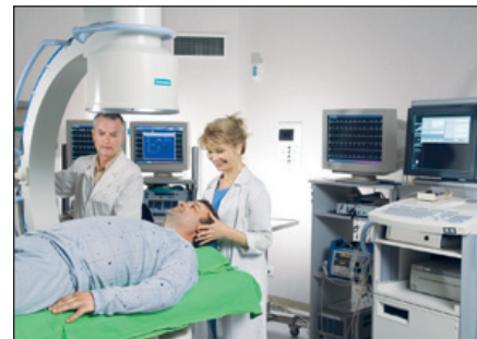
Vizsgálat a hemodinamikai laborban

Megyénkben mintegy 40-50 000 cukorbeteg él, és hasonló nagyságrendű a pajzsmirigybetegségek előfordulása is. Nyíregyházán a IV. Belgyógyászati Osztály az anyagcsere-betegségek megyei központja. Jelenleg 69 ágyon gyógyítják a betegeket, ebből 20 ágy úgynevezett. profilágy. Naponta 2 diabetes- és 2 pajzsmirigy-szakrendelés fogadja a betegeket. Az endokrin-szakrendelésen 2010-től nyílt lehetőség arra, hogy az endokrinológusok helyben pajzsmirigy-ultrahangvizsgálatokat végezzenek, ez jelentősen lerövidíti a betegek ellátását. 2012-ben mintegy 50 000 ambuláns betegellátás történt, és 2700 fekvőbeteget kezeltek az osztályon. Az országban egyedülálló, képzett szakembergárda dolgozik itt, képzett szakdolgozók, oktatók, egy dietetikus, három diabetológus, három lipidológus, hat endokrinológus végzi a betegek ellátását. Az osztály több speciális feladatot is ellát: inzulinpumpa-centrum, folyamatos szöveti vércukor-monitorozást végez, terhességgel szövődött cukorbetegség központja, Kelet-magyarországi Diabetetes Neuropátia Centrum. Az itt dolgozók kiemelt fontosságúnak tartják a betegoktatást, az országban