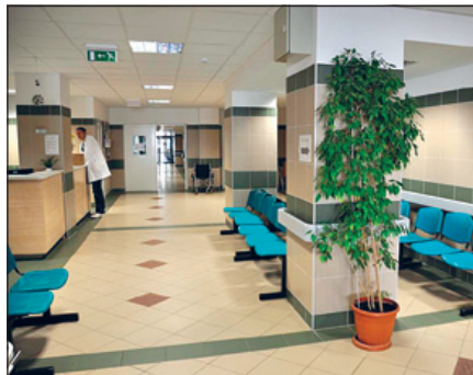
A kor színvonalának megfelelően

A fejlődési trendek közül jelen projekt a kórház SO1 szintű sürgősségi ellátásának a kor színvonalának megfelelő fejlesztését teszi lehetővé. Kórházunk egy depressziós, kedvezőtlen egészség-