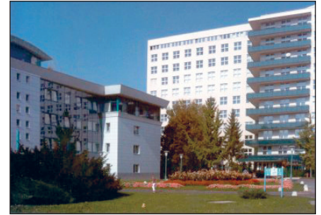
„Súlyponti kórház” a salgótarjáni

megőrizzük a lakosság bizalmát, ezért készítettük el a Tarjáni Kezelő-Lap című tájékoztató kiadványt, melyet minden hozzánk érkező beteg megkap. Kérem, fogadja lapunkat olyan jóindulattal, amilyennel mi elkészítettük önnek! Köszönöm, hogy megtisztelt bennünket bizalmával, és hozzánk fordult egészségügyi problémájával! Engedje meg, hogy mielőbbi gyógyulást kívánjak!