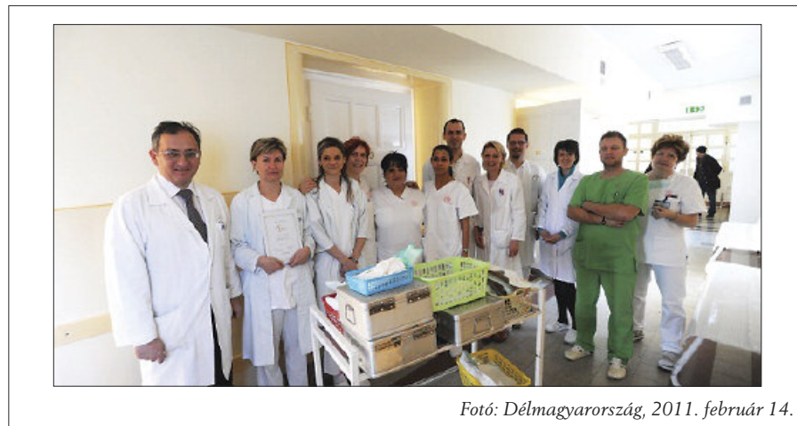
2011. február 14.