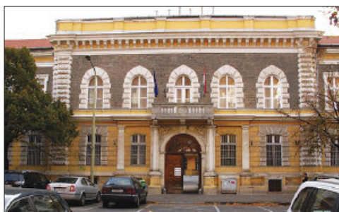
A Klinikai Központ Elnöki Hivatalának épülete

Először is engedje meg, hogy köszöntsem Önt a Szegedi Tudományegyetem Szent-Györgyi Albert Klinikai Központ beteglátó szervezeti egységében! Intézményünk regionális ellátási központként működik, ellátási területébe – szakmánként különbözően – Szeged város, illetve Csongrád megye tartozik,