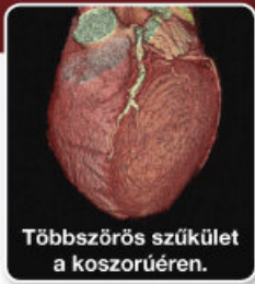
Többszörös szűkület a koszorúéren.