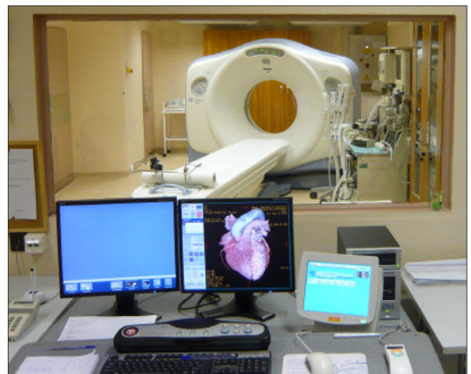
Korai stádiumban fedezhetőek fel a súlyos lefolyású betegségek

A Szegeden és vonzáskörzetében élő emberek gyógyulását nagy mértékben szolgálja, hogy a cég beruházásainak köszönhetően a Klinikai Központban ma a Magyarországon létező valamennyi képalkotó diagnosztikai eljárás elvégezhető, a PET CT felvétel kivételével.