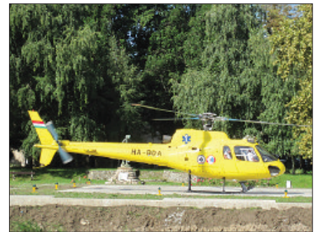
Egy egyszerű leszállóhely volt az elképzelés, de az előírások megváltozásával ezt menet közben repülőtérré minőségűre kellett fejleszteni

A fejlesztéshez kapcsolódva orvosi műszerekkel is bővül az osztály. Beszer-