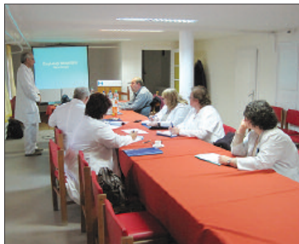
Közös szakmai továbbképzésen

Szentesen megújul a mozgásszervi rehabilitációs osztály épülete és esz-