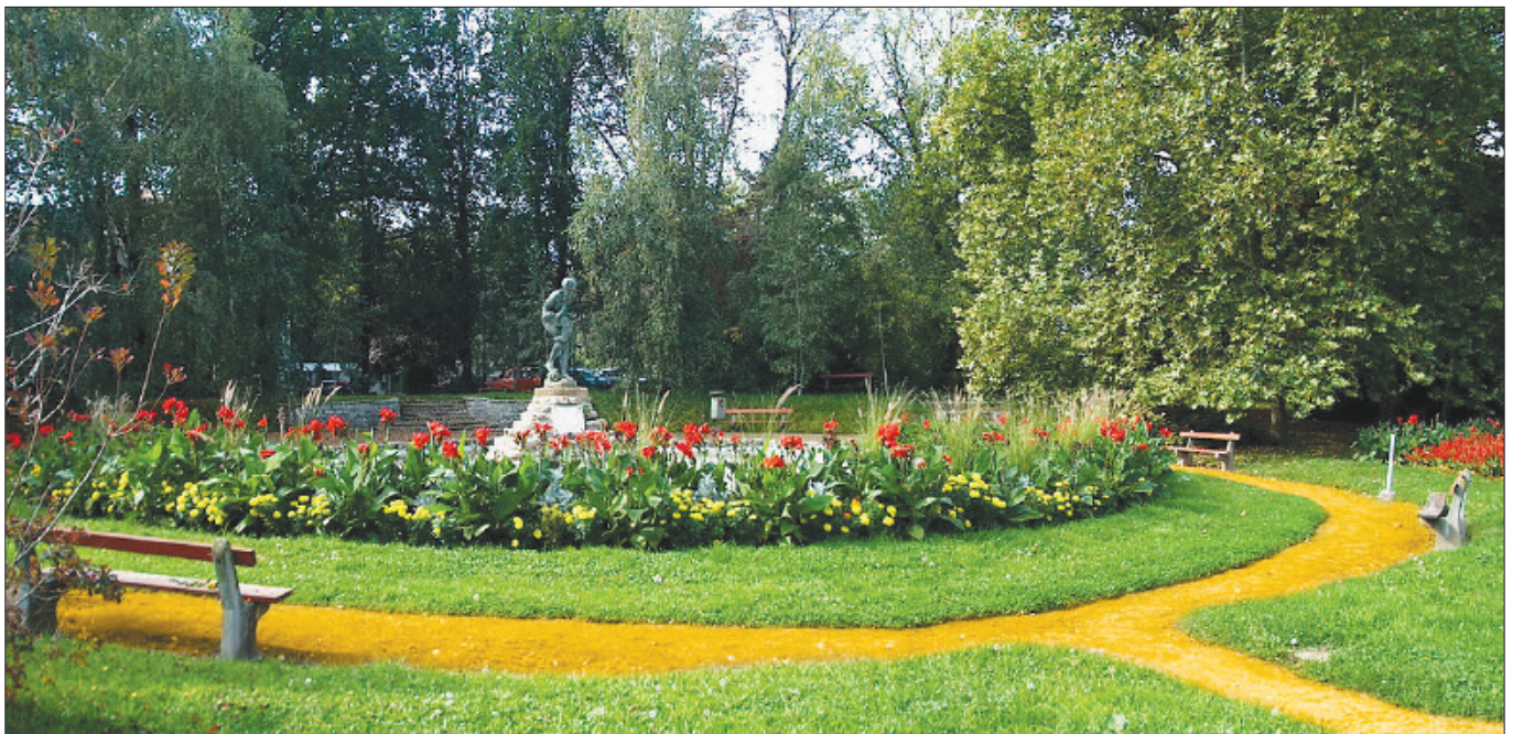
Kórházunk az Alföld egyik legszebb parkjában működik

ram. Napjainkban az orvosok és szakdolgozók külföldre vándorlása jellemzi az egészségügyet, ezért úgy gondoljuk, hogy tudatosan kezelni kell a kérdéskört. A versenyképesség miatt kiemelt figyelmet kell fordítani az intézményi orvosokat és ápolókat vonzó képességé-