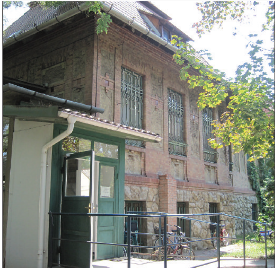
Hamarosan indul a mozgásszervi-rehabilitációs osztály rekonstrukciója

Munkatársaink számára szűrőprogramot hirdettünk, melyben szemészeti, lúdtalp-, kardiológiai vizsgálatok, nőgyógyászati, spirométeres, csonttritkulás-, diabétesz- és ultrahangszűrés, diétás és pszichológiai tanácsadás szerepelnek.