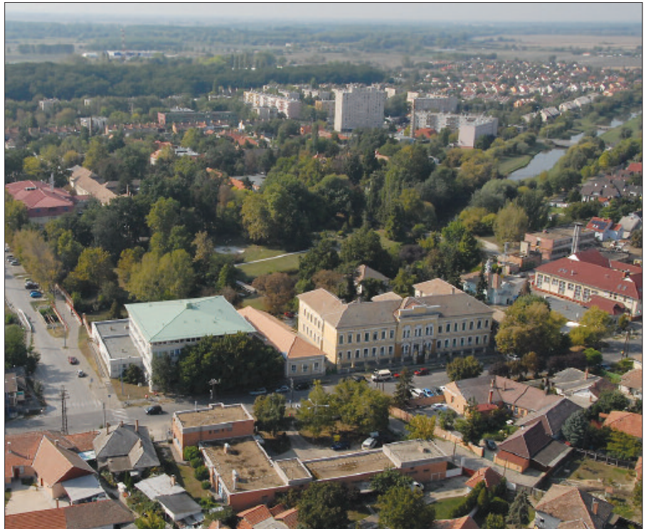
Az intézmény jelenlegi pavilonrendszerű felépítése üzemeltetési szempontból nem hatékony

Az intézmény jelenlegi pavilonrendszerű felépítése üzemeltetési szempontból nem hatékony, az épületállomány műszaki adottságai, felszereltsége miatt versenyképességünk erősen korlátozott, ennek érdekében történtek fejlesztések az elmúlt időszakban, illetve távlati célkitűzések is megfogalmazódtak. A sürgősségi betegellátó osztály bővítésére, fejlesztésére vonatkozó pályázat megvalósítása a végéhez közeledik, hamarosan indul a mozgásszervi rehabilitációs osztály rekonstrukciója, illetve elkészült az a műtéti tömb létrehozására vonatkozó pályázat, amely a legmodernebb körülményeket tudná biztosítani az operációkhoz, közülük