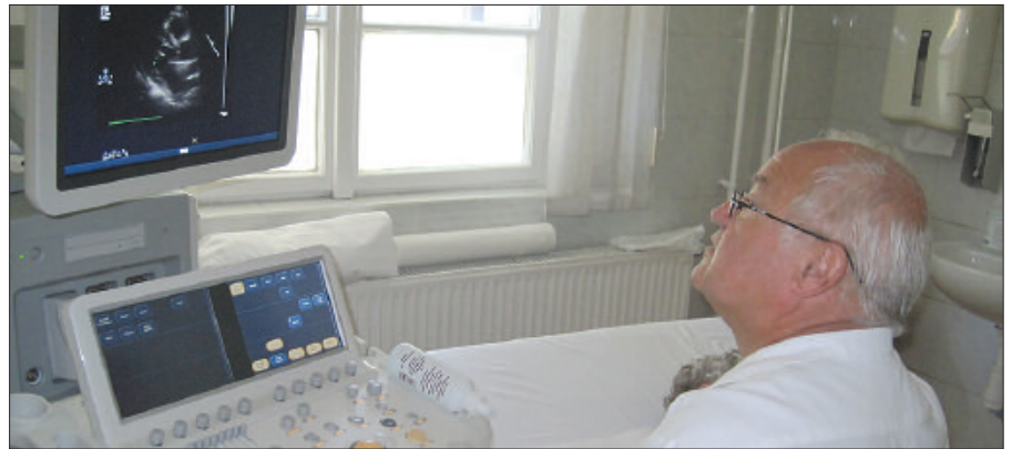
Vizsgálat az egyik legkorszerűbb ultrahangos készülékkel

Az elmúlt hónapok legnagyobb léptékű előrelépése ebből a szempontból intézményünkben, hogy a Csongrád Megyei Önkormányzat és a szentesi önkormányzat jóvoltából mintegy harmincmillió forintos kardiológiai eszközzel bővültek orvosi műszereink. A belgyógyászati osztályon így lehetőség nyílik az osztályos betegek helyszíni vizsgálatára az egyik legkorszerűbb ultrahangos készülékkel. A kórház a vizsgálatához szükséges helyiség átalakítását önerőből végezte el.