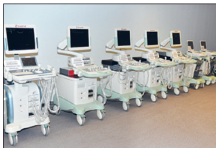
Ultrahang diagnosztikai készülékek