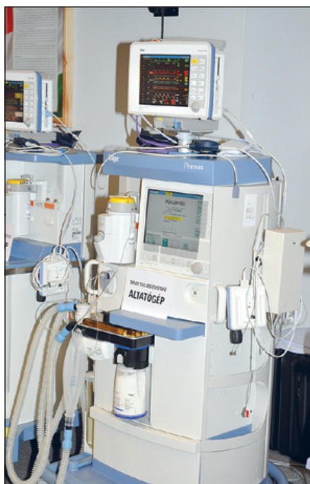
Nagy teljesítményű altatógép