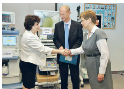
Az átadás pillanataiban...