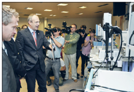
Dr. Szócska Miklós a fotósok gyűrűjében