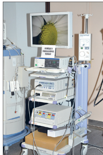
Sebészeti endoszkópos torony