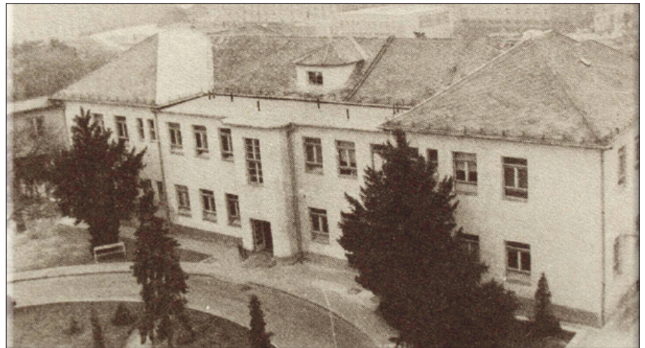
Kórházunk történetének egy későbbi szakasza: a sebészet, majd szülészeti 1903-ban épült

A tervek szerint az új ispotály hossza 19 öl (kb. 38 m), szélessége pedig 8 öl (kb. 16 m), középen végig folyosóval ellátva, két oldalt szobákkal. A természetes világítás a folyosó két végén történt. Az épület alatt pince volt, föld