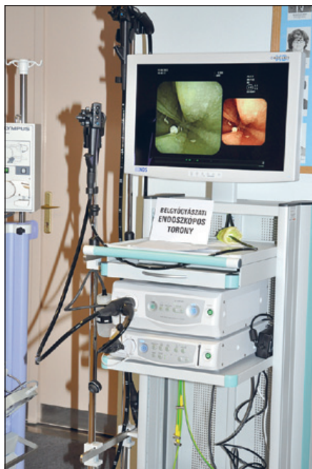
Belgyógyászati endoszkópos torony

Az elmúlt hetekben 2,6 milliárd forint értékű orvosi gépekkel és műszerekkel gazdagodott kórházunk. Szeretnénk itt kedves olvasóinknak bemutatni néhányat.