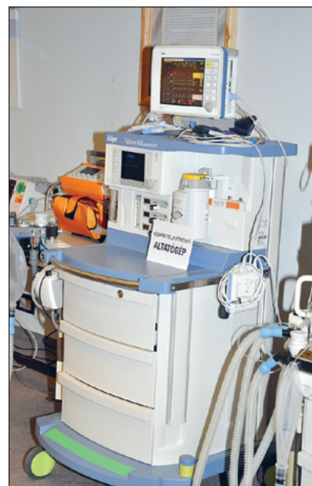
Közepes teljesítményű altatógép