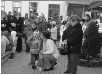
Mozdulj rá! – hirdették a szervezők. És mozdultak