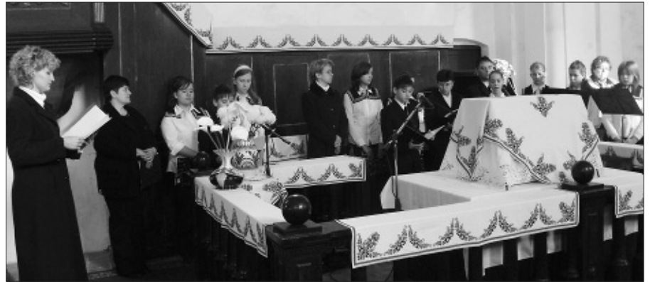
A gyerekek szolgálata a templomépítés mozzanatait elevenítette fel