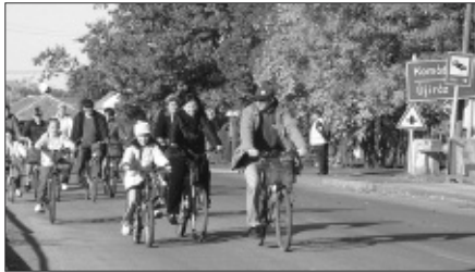
Ki két keréken indult...