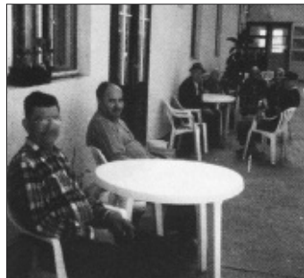
Az „első fecskék” (archív felvétel)