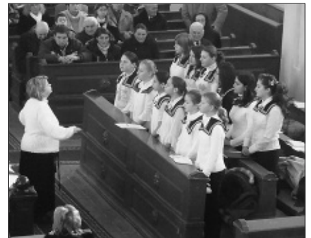
Az iskola dalosai...