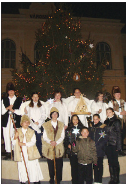
A betlehemes játék nagy sikert aratott

A városi fenyőfát sok ügyes kéz öltöztette karácsonyfává, mely december 4-én műsorral, igei és városköszöntővel került ünnepélyes átadásra. Iskolásaink hangulatos betlehemes játékkal lepték meg a művelődési ház közönségét.