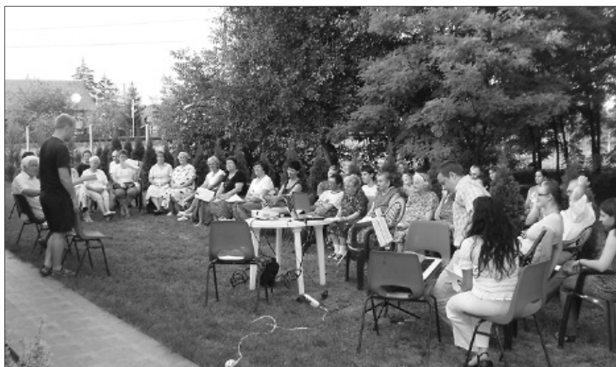
Az idősek is jól érzik magukat a Pap-tanyán