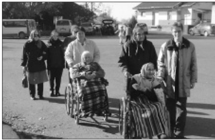
...ki négy keréken tette meg az emléktúrát