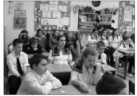
Több mint 250-en vettek részt a vetélkedőkön