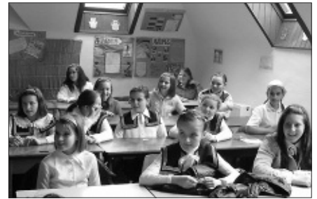
Ünnepelőben – a lélek is