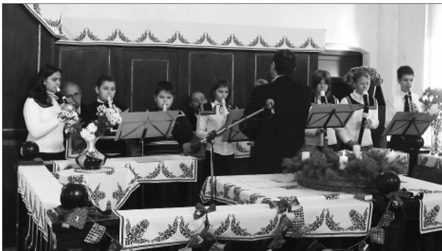
A gyerekek zenés szolgálata még meghittebbé tette az istentiszteletet