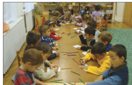
Az ismeretek elmélyítését segíti a színezés is...

Isten igéjére már az óvodás gyermekek is nyitottak és fogékonyak. Az életkori sajátosságainak megfelelő és könnyen érthető bibliai történetekkel játékosan ismerkednek; elmélyítésüket az énekek, színezések teszik változatosabbá. Fontos feladatunknak tartjuk, hogy e foglalkozások alkalmával elveszük az „igemagot” a gyermekekben, mely értékes személyiséggé formálja őket.