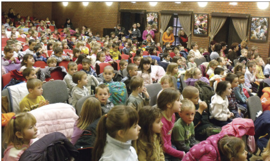
Sokan várták, hogy az idén is meglátogassa őket a Mikulás

December 6. délelőttjén a művelődési ház megtelt izgatott ovisokkal, bölcsisekkel, akik az idén is nagyon várták, hogy meglátogassa őket a Mikulás. Krampuszai kíséretében hamarosan meg is érkezett a várva várt vendég, és