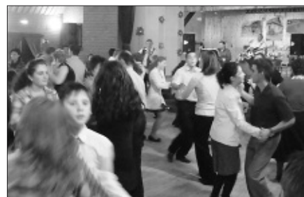
A táncosok csak a tombolahúzás idején pihentek