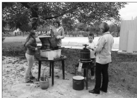
Valaha ilyen gépekkel dolgoztak szüret idején