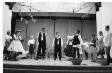
A pedagógusok is színpadra léptek