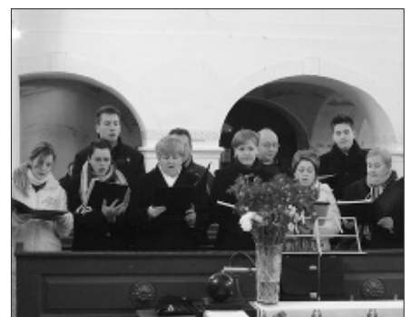
...és a szeghalmi vendégkórus