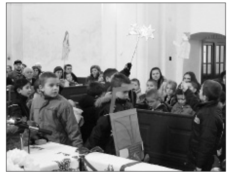
A harmadikosok családi istentisztelete advent harmadik vasárnapjára esett