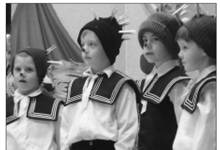
A kicsik mesejátékot adtak elő