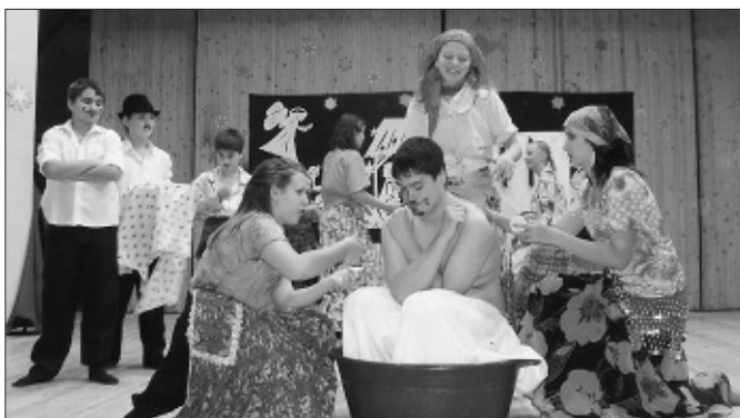
Színjátszóink fergeteges komédiát mutattak be