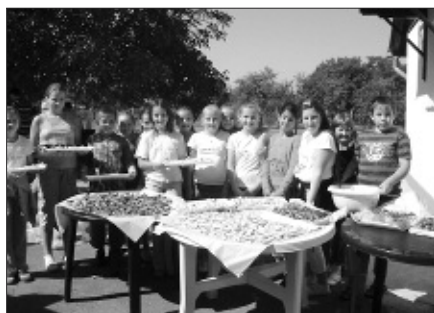
Az aszalt gyümölcs télen gazdag vitaminforrás