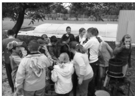
Ez aztán a finom innivaló!