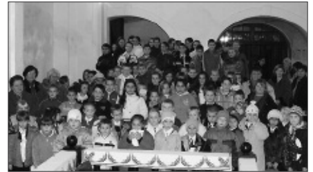
Az istentiszteletre eljött az iskola apraja-nagyja