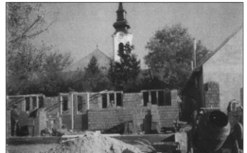
A korabeli felvételen a hospice-rész építése látható