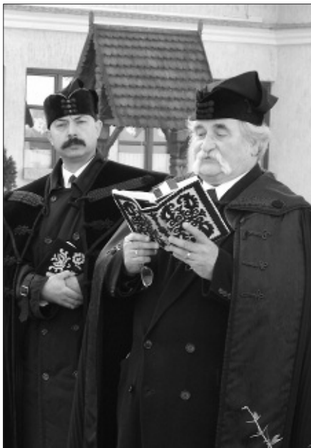
Iskolánk névadójára emlékeztek

Advent a keresztyén kultúrában a karácsonyt megelőző négy hétig tartó időszak. A karácsonyi ünnepkör advent első napjával kezdődik. (Ez a vasárnap egyben az egyházi év kezdete is.) Várakozunk, várjuk az Úr eljövételét a saját életünkben is, hogy keresztyén életvitelünkkel minél közelebb kerüljünk Istenhez. Ezekben a hetekben iskolánk is megújul, megszépül: minden osztályban ott díszleg az adventi koszorú, melynek gyertyáit közösen gyűjtjük meg minden héten. A vasárnapok ünnepi alkalmai is jelzik a közelgő nagy ünnepet. A gyerekek zenés, verses szolgálataikkal még meghittebbé teszik ezeket az istentiszteleteket. Az itthoni szolgálattelvők mellett vendég lelkészekkel is találkozhattunk. Idén a szeghalmi „Pro Musica” kamarakórus örvendeztette meg a gyülekezetet.