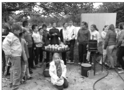
Mustkóstolóra készül a dolgoz csapat