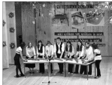
Nagy sikert arattak a citerások műsorukkal

November 12-én este megtelt a művelődési ház nagyterme és folyosója is a „Gyermekeinkért” tartott jótékonyági est kezdetére. A komoly igei gondolatokat a gyermekek tánca és furulyaszó foglalta keretbe, a felnőttek tánca után a citera zengett, végül a pedagógusok színdarabja igyekezett a jókedvet növelni. Az asztalok roskadoztak a sokféle finomságtól. Vacsora után a táncos mulatságban a tombolahúzás ideje jelentett pihenést. Hálásak vagyunk Istennek a jókedvű adakozók szívbeli ajándékáért.