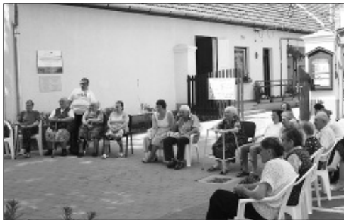
Az otthon lakói örömmel fogadnak minden rendezvényt