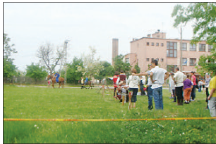
Volt, aki a nyilazással is próbálkozott