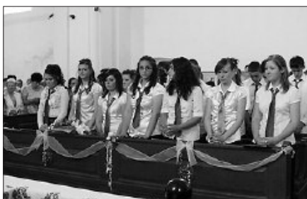
Torokszorító szép pillanatok voltak