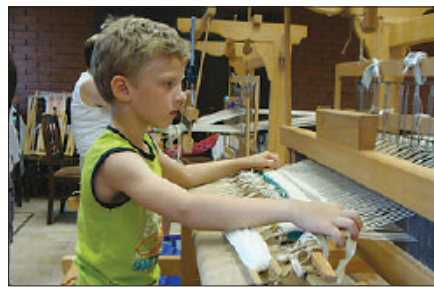
Mindenki érdeklődése szerint választhatott

Lehetőséget kínálunk évről évre tábori formában az idegen nyelv gyakorlá-