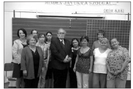
Tizenegy résztvevő vette át tanúsítványát

Az Európai Önkéntesség Éve jegyében a Béthel Alapítvány önkéntesek képzését tartotta június 18-án és 25-én. A rendezvény házigazdája a Vésztői Református Egyházközség volt. A résztvevők megismerkedhettek az önkéntesség adta lehetőségekkel a Kapu program működésén keresztül, valamint fejleszthették azon készségeiket, amelyekkel hatékony önkéntes segítővé válhatnak a szociális szféra területén. Mindezeket az ismereteket szakképzett Kapu-trénerek biztosították. A tréning végén tizenegy résztvevő vette át a Kapu-önkéntes tanúsítványt, mellyel az egész ország területén vállalhatnak munkát. Az önkéntes munka kiváló alkalom többek között a pályakezdők munkatapasztalat szerzésére, a nyugdíjasok számára a magány elkerülésére, a munkanélküliek munkaerőpiacra való visszahelyezésére, az életen át tartó tanulásra, a kapcsolatépítésre és nem utolsósorban mások önzetlen megsegítésére.