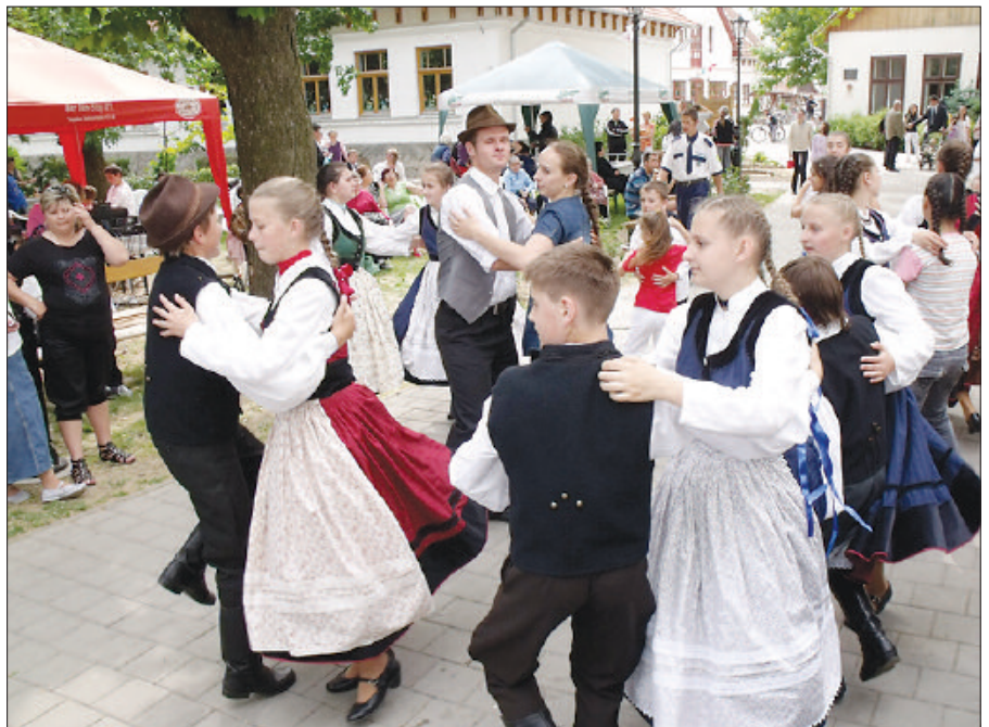
Több százan vettek részt a hármás ünnepen