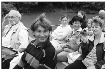
Hajókirándulás a Tisza-Bodrog összefolyásánál

A szeretetotthon munkatársi közössége július 6-án Isten áldásával kirándulni indult, Tokaj-Szerencs környékére. Elsőként a tokaji tv-toronykilátót és a hegyvidék szépségét csodálhattuk meg. Ezt követte a hajókirándulás a Tisza-Bodrog összefolyásánál, majd részt vettünk egy borkóstolón a Hudácskó pincészetben. Szerencsen megtekintettük a felújított református templomot, a várat és a csokoládégyár mintaboltját. Külön érdekesség volt számunkra a református templom történelmi múltja és Rákóczi Zsigmond ott elhelyezett szarkofágja. Debrecenben finom vacsorát fogyasztottunk el. Élményekkel gazdagodva érkeztünk haza.