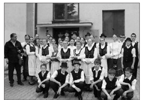
Belopták magukat vendéglátóik szívébe