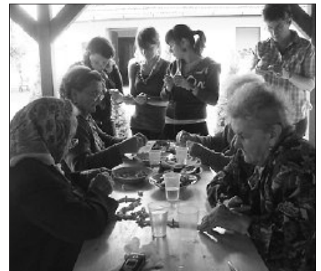
A Pap-tanyán mindig érdekes program várja őket