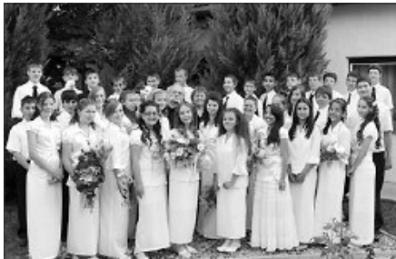
Immár az egyház teljes jogú, felnőtt tagjai