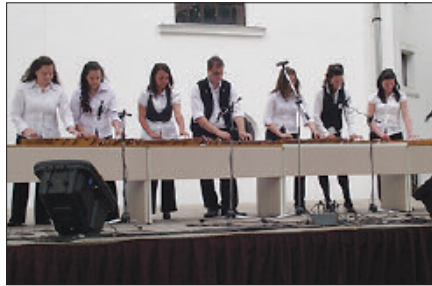
Az egyik helyszín, a templomkert