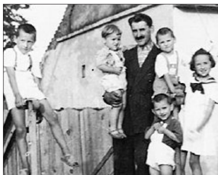
Öt gyermeke körében, 1958-ban