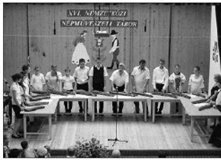
A népművészeti tábortanban is nagy sikert arattak

Augusztus elején felkérést kaptunk egy falunapra, Dorfgasteinbe. A hosszú út után fáradtan, de annál nagyobb örömmel érkeztünk meg a csodálatos völgybe, ahol citeráztunk az osztrák közönségnek. A falunap alkalmából kirakodóvásárt rendeztek, ahol magyar kézművesalkotásokat is bemutattak. A vésztői asszonyok kürtöskalácsot sütöttek.