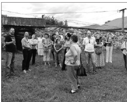
Első útjuk Berzétére vezetett