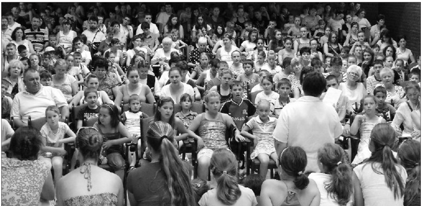
A közel négyszáz táborlakó megtapasztalta az együtténeklés örömét