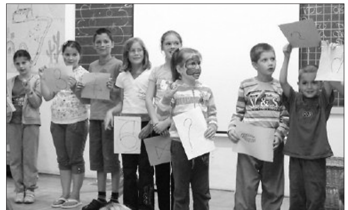
A foglalkozások vidám, játékos formában zajlottak