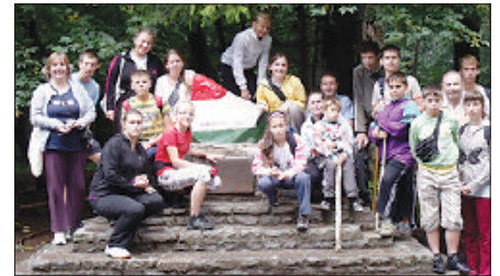
Pihenőhét a hegyekben