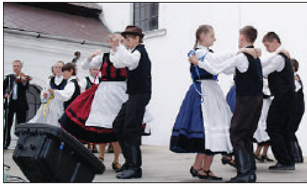
Jó volt találkozni, ünnepelni

Beharangoztak 2011. május 15-én, délelőtt fél 10-kor a vesztyői református templomba. Sárrét legszebb hangú hangja küldte a könyörületet szerető hívó szavát: jöjjetek, találkozzunk, ünnepeljünk együtt a háromszáz éves településünket, a templomkertben őrködő száz éves platánt és a húszéves iskolánkat.