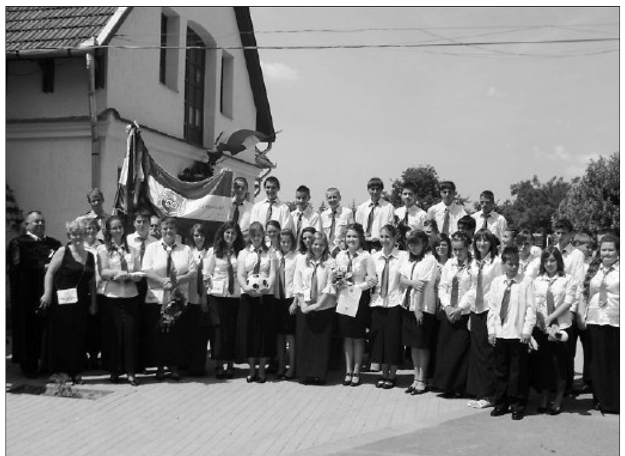
Tarisznyájukban az íge: Ne félj, és ne rettegj, mert veled van Istened