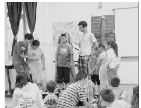
M. S. A. Ki a legügyesebb?

met nyelven. A résztvevők között szép számmal vannak évről évre visszajáró táborozók, akik tudják, hogy a tábor remek lehetőséget ad az idegen nyelv gyakorlására az élő angol és német beszéd által. A foglalkozások vidám, játékos formában zajlottak, amelyek kellemes emlékként élnek tovább a gyermekek szívében.