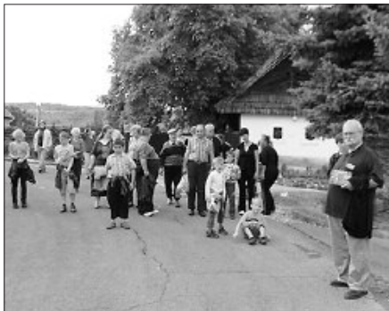
Most a palóc jellegű településeket nézték meg