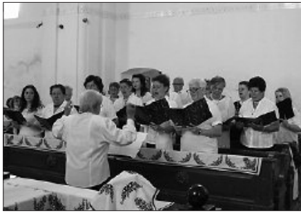
Szolgálat az ünnepi istentiszteleten