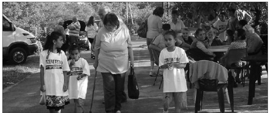
Közel százötvenen lettek részesei a vidám délutánnak