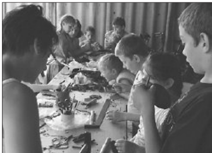
Ki faragott, ki szőtt, ki kosarat font...