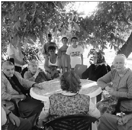
Fiatalok és idősek – együtt

Igazi hídépítés vette kezdetét Vésztőn az idei Szeretethíd rendezvény keretében. Híd épült a generációk között – a fiatalok építették az idősebbek felé –, és híd épült az egyház és a város civil szervezetei között. A gyülekezet missziós házában, a Pap-tanyán készültek műsorral és vendéglátással a Kis Bálint Református Általános Iskola nyolcadikosai, akikhez a hetedikesek is műsorral csatlakoztak. Meghívták a Pap-tanyára a gyülekezet tagjait, a református szeretetotthon lakóit, a Pallasz Athéné Városvédő Egyesületet, a Bartók Béla Népdalkört és a városban működő idősek klubjait. Közel