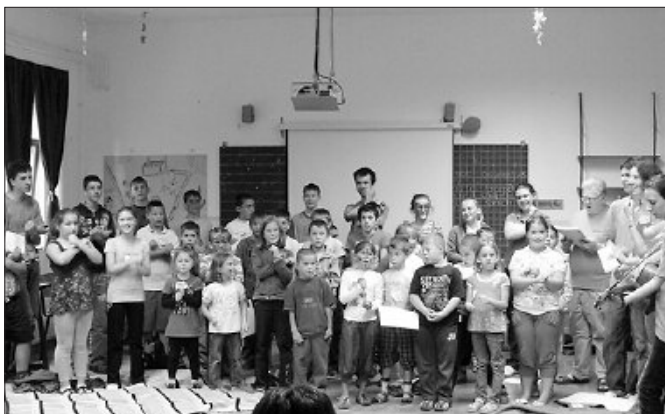
Negyvenen tanulhatták a bibliai történeteket idegen nyelven