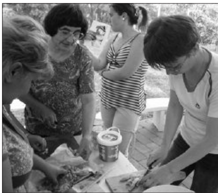
Készül az ínycsiklandozó pörkölt