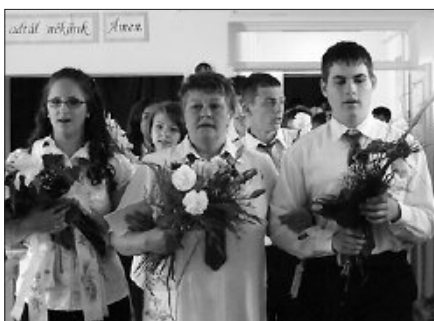
Még egyszer, utoljára...