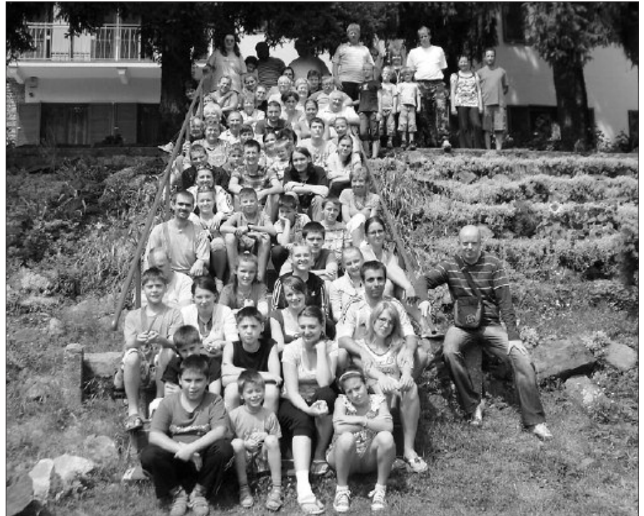
Együtt, csaknem hetvenen – lehet utánaszámolni