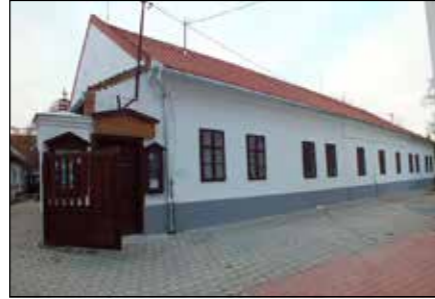
Az utcafront, az átalakítás után