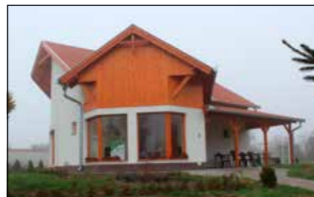
Az épület minden igényt kielégít

A Pap-tanyán, 2015 tavaszán adták át ezt a közösségi épületet, hogy az erdei iskolai programok megvalósításának megfelelő helyet biztosítson. A helyi hit- és közösségi élet ápolásán túl az igények teljes körű kielégítése érdekében egyre fontosabbá vált egy új akadálymentesített épület kialakítása, melyben egy előadóterem, egy foglalkoztatószoba, vizesblokk és egy konyha várja a vendégeket. Az előadóterem lehetőséget nyújt rendezvénysorozatok szervezésére és iskolai csoportok fogadására.