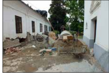
Míntha bombatalálat érte volna az épületet