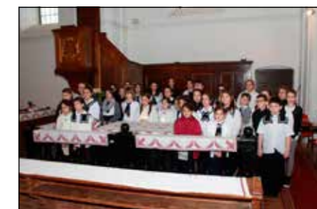
A viszontlátás reményében búcsúztak