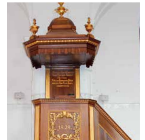
A megújult szószék

Műemlék parókiánk 225 éves volt, amikor az Emmi Szociális Államtitkársága által kiírt pályázat segítségével,