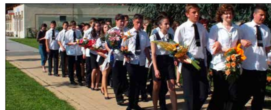
A búcsúzóik közül sokan sikeres tanulmányi- és sporteredményekkel büszkélkedhetnek