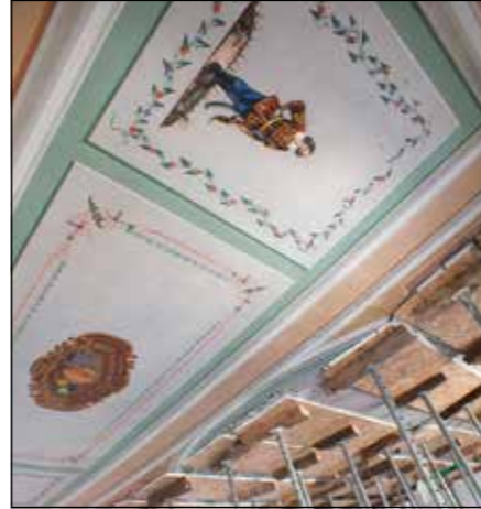
Aki tanúja volt a restaurátor munkájának...