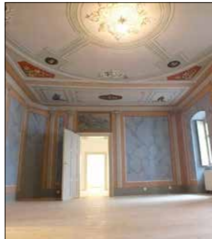
...csak ámul, mi lett az állványerdő nyomán