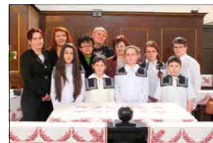
Vésztői versenyzők, felkészítőjükkkel