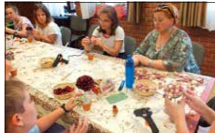
Új életre kelnek a virágok