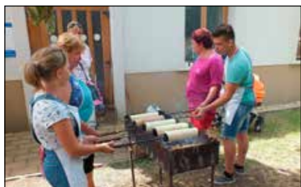
Sül a kiirtós kalács

A népművészet drága kincs. Sokféle módon óvjuk mi magyarok ezeket az értékeket hazánkban. Vésztőn, ebben a piciny viharsarki városban, idén XXI. alkalommal rendezték meg a magyarságtalálkozóval egybekötött népművészeti tábort. A rendezvényen több mint háromszázan vettek részt, köztük neves művészek: Budai Iлона Kossuth-díjas népdalénekes, előadóművész, vagy Széles András citeraművész... Istennek legyen hála a sokszor erőn felüli munkáért és áldozatért, és mindazokért, akik évről évre lehetővé teszik, hogy Isten igéje köré gyűlve valóban értéket, drága kincset adhassunk át a fiatal nemzedéknek!