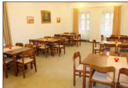
Új ebédlő lett