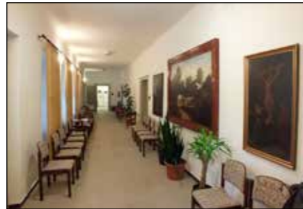
...hogy ilyen szép folyosón üldögélhetünk