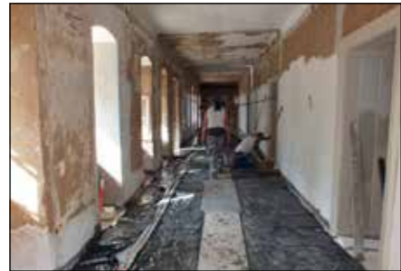
Kevesen bíztak benne akkor...