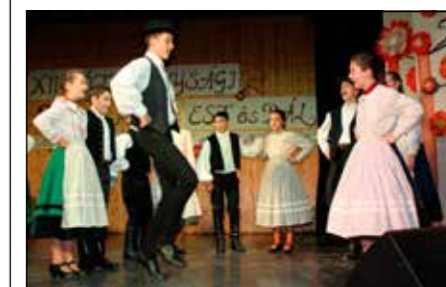
Szemet gyönyörködtető műsor

„Jótekonyságról és az adakozásról pedig el ne feledkezzetek, mert ilyen áldozatokban gyönyörködik az Isten...” A Református Egyházközség intézményeivel – áldozatos munkával – tizenharmadik alkalommal rendezett jótekonysági estet és bált, ezúttal templomunk hangosításáért és gyermekeinkért. Nagy sikerünket példázza, hogy sokan megtisztelték jelenlétükkel az estünket, szórakoztak a szemet gyönyörködtető műsorok között. Majd a finom vacsora után a zene ritmusa a táncparkettre csalt minden kedves résztvevőt. Lázás készülődéssel várta a vendégsereg a tombolasorsolást is. Szép volt! Jó volt! Találkozunk jövőre újra ugyanitt!