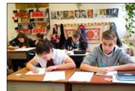
Néhányan a harmincnyolc indulóból...