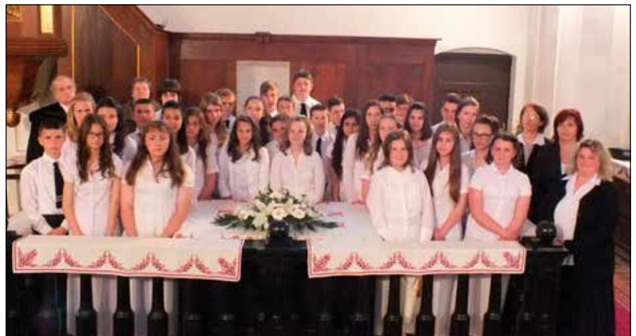
...Megerősödött hittel: konfirmandusok