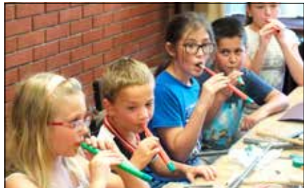
Készül a furulya