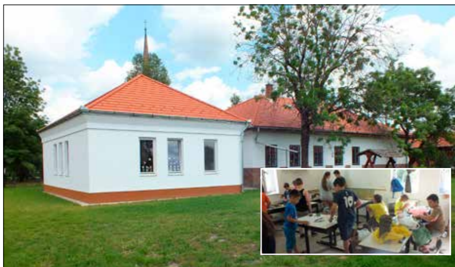
Az alkotni vágyó gyermekek új otthona a Wesselényi úton