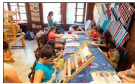
A szőnyegszövés is népszerű a táborban